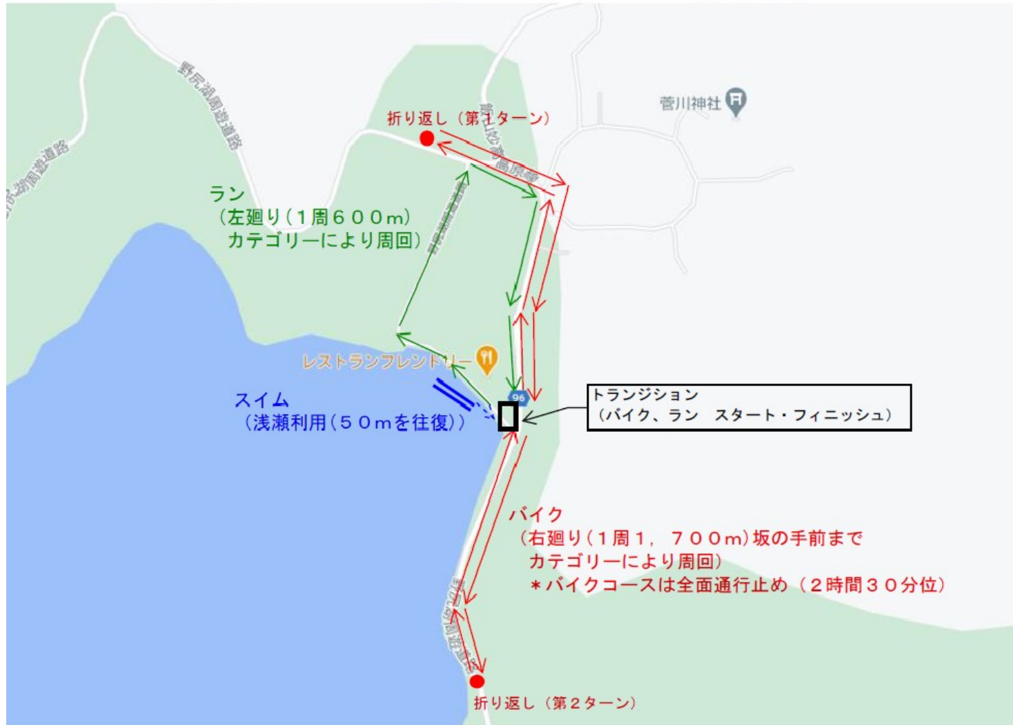
『のじりっ子トライアスロンフェスタ』コースマップ (菅川地区)